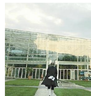
Una scena del video

«L'idea del film è nata un anno e mezzo fa per celebrare gli 800 anni della nostra università e ha richiesto uno studio approfondito della storia dell'ateneo di Padova, delle grandi personalità che l'hanno attraversato e reso celebre nel mondo. Il film vuole soprattutto testimoniare questo lungo e virtuoso percorso fatto di scoperte, ricerca critica ed