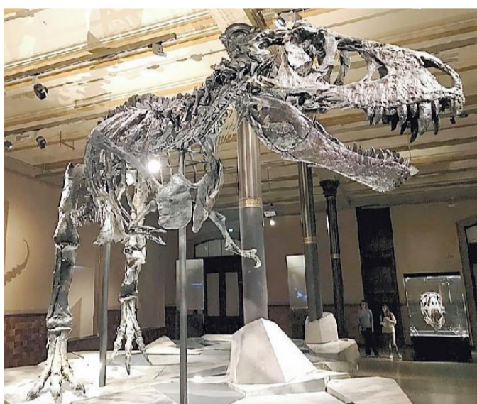
Uno degli scheletri che saranno esposti nella mostra in Fiera a Padova

«Contrariamente all'immaginario collettivo, che dipinge i dinosauri come mostri violenti e voraci – spiega il curatore Ilario de Biase – il loro comportamento era invece più simile agli attuali mammiferi: cercavano cibo e acqua, puntavano a riprodursi e proteggersi fra loro, prendendosi cura dei loro simili in caso di malattie e parassiti. Per questi motivi la mostra cambierà nel visitatore l'immagine di queste "terribili lucertole" grazie ad un'inedita collezione di fossili originali di dinosauri, riuniti insieme per la prima volta, supportata visivamente da ricostruzioni animate, animatronics in scala 1