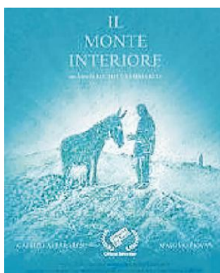
La locandina del film

Laureato in Arti visive e dello spettacolo allo Iuav di Venezia e diplomato in Regia cinematografica alla Civica scuola di cinema "Luchino Visconti" di Milano, Sammarco